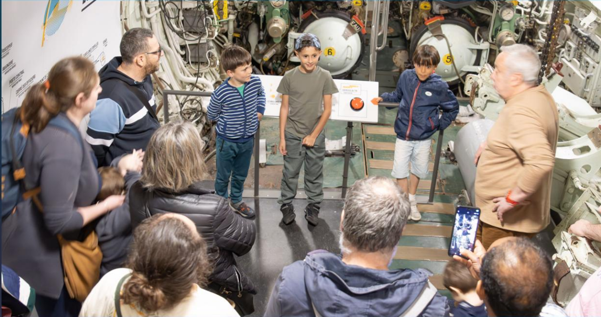
Le samedi 10 avril 2026

Une belle expérience de médiation culturelle inversée , où les élèves deviennent passeurs de mémoire et acteurs d'un patrimoine industriel et maritime unique.