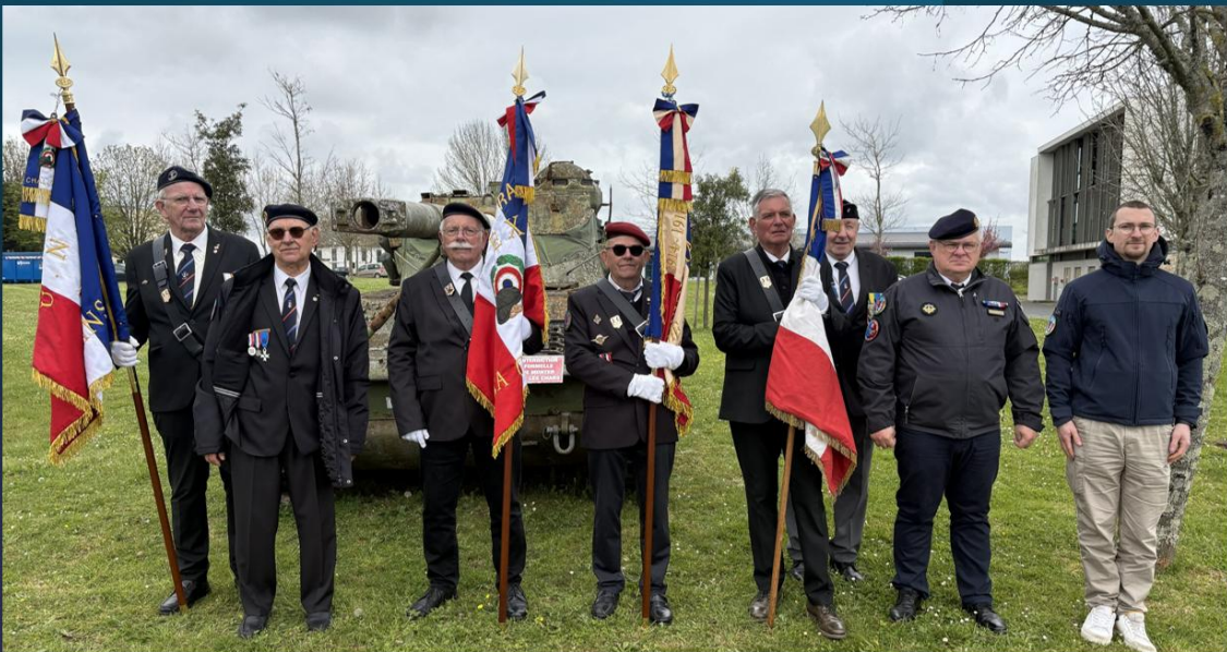
Saint-Maixent le 2 avril 2026

La journée à St Maixent s'est clôturée par une visite guidée du Musée des sous-officiers de l'ENSOA.