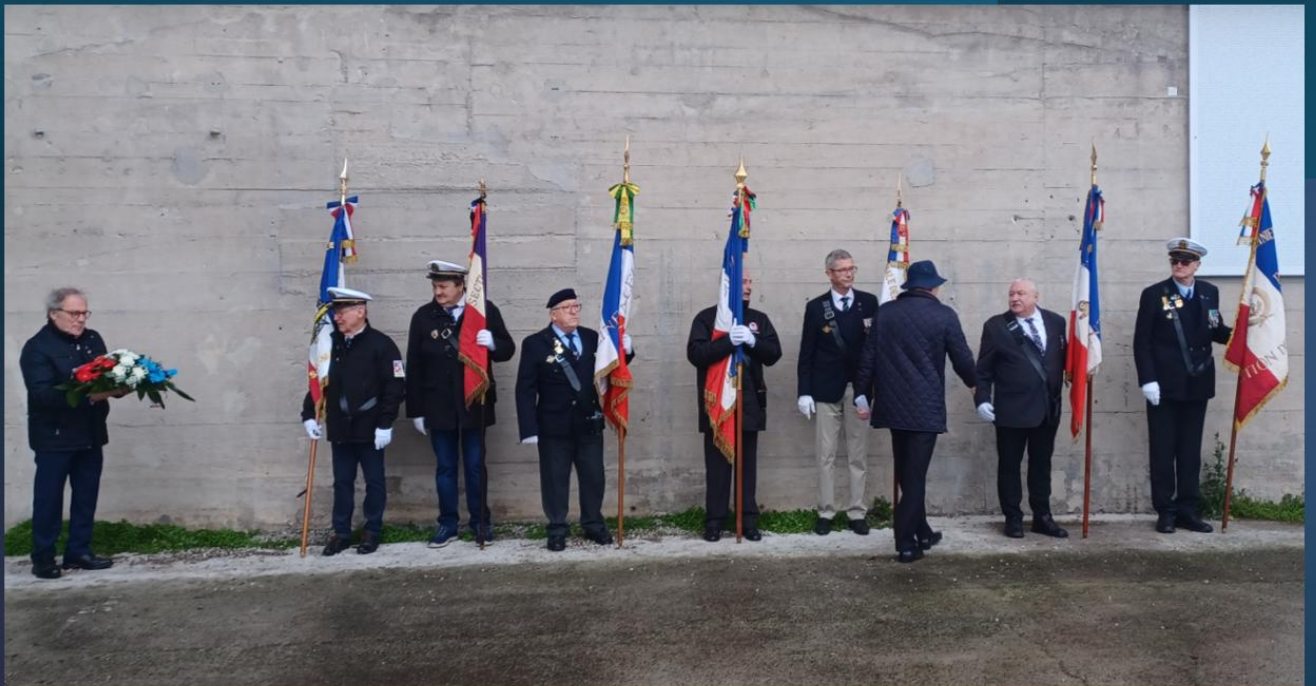
Cérémonie du souvenir