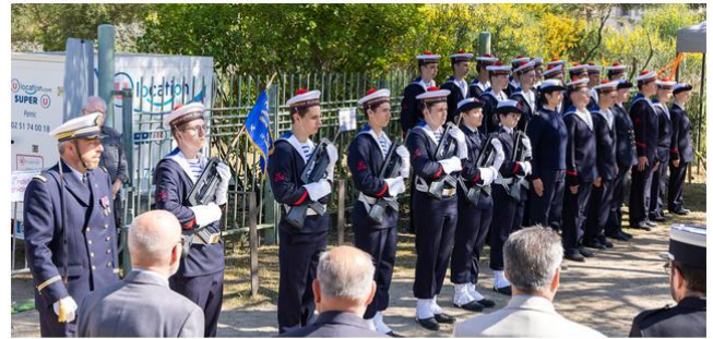
Musée de Mindin le samedi 25 avril 2026