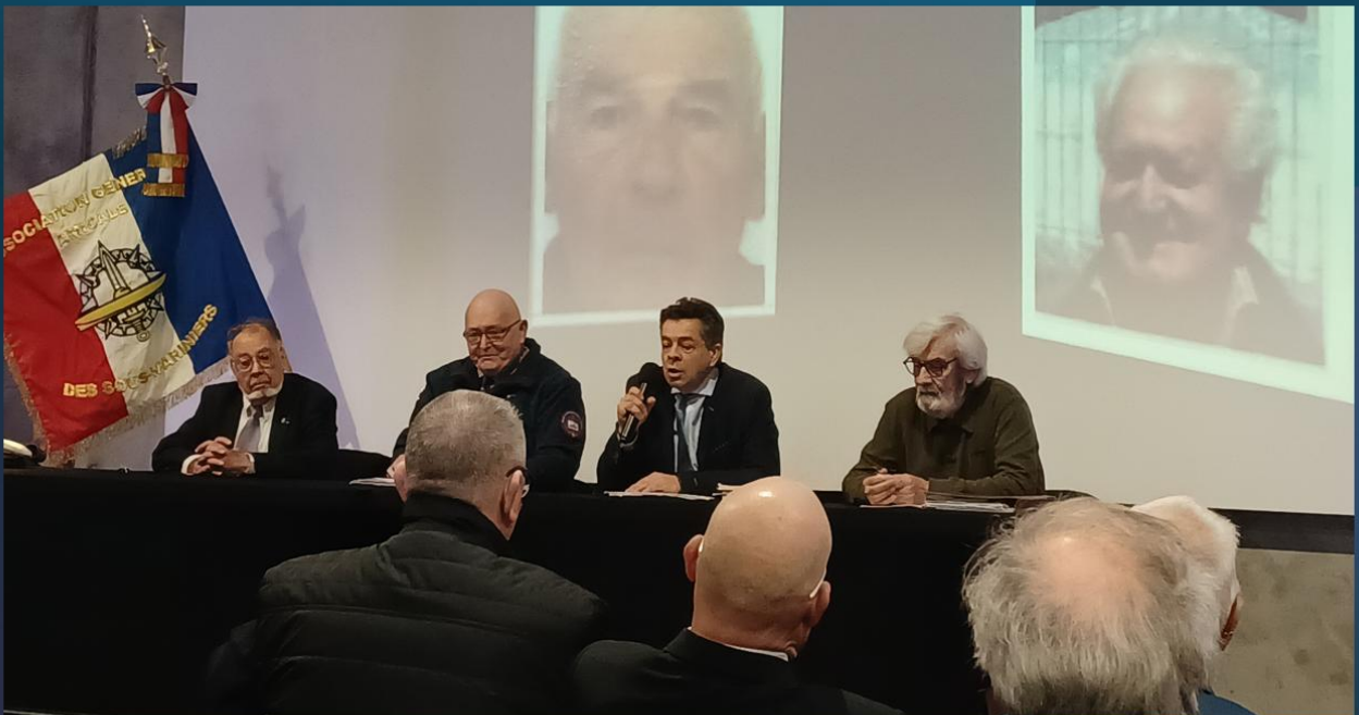
AG MESMAT du 1 mars 2026