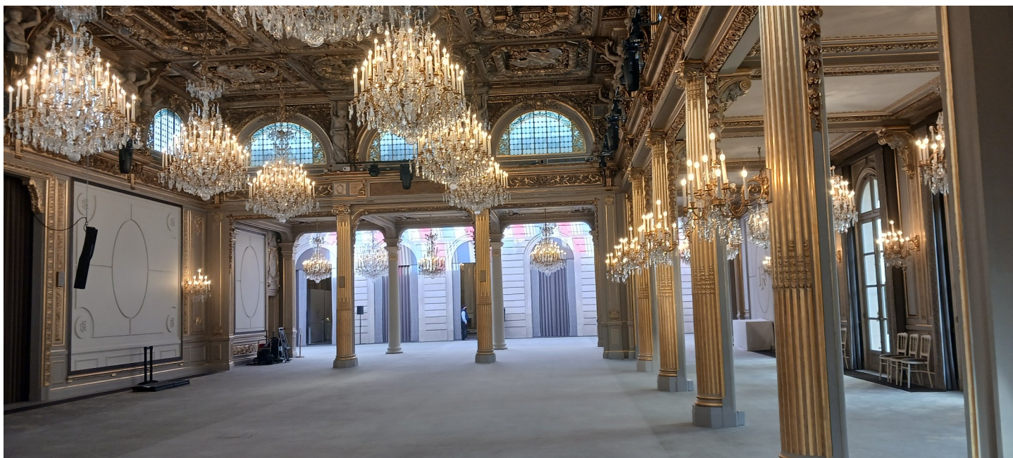
La salle des fêtes