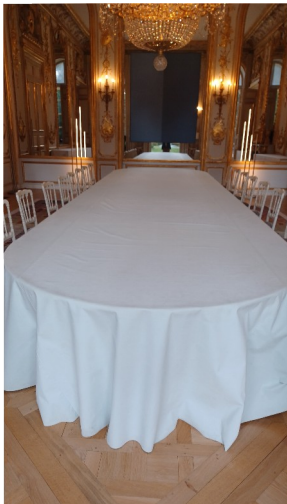
Table du conseil des ministres et salle de fêtes