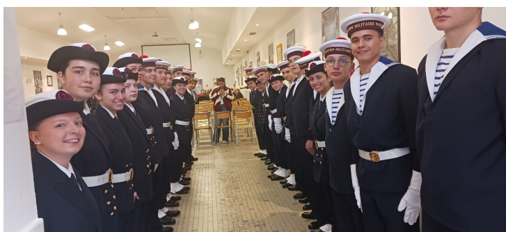
Ovation d'encouragement pour leur camarade