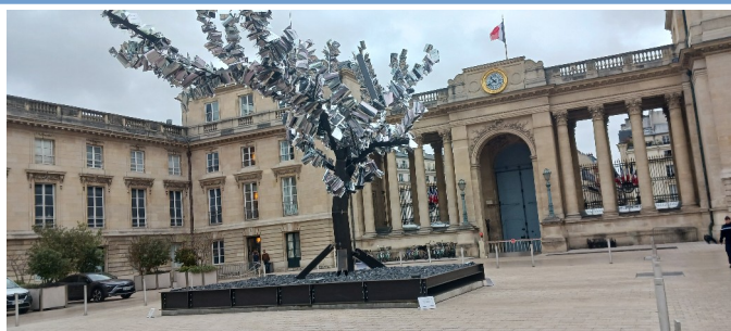
La cour intérieure