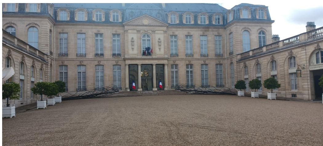
L'entrée et la cour de l'Elysée