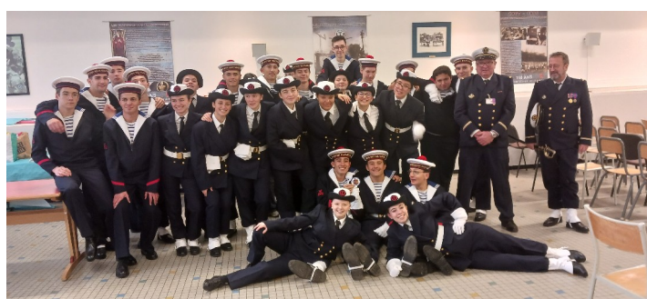
L'équipage déjà très soudé