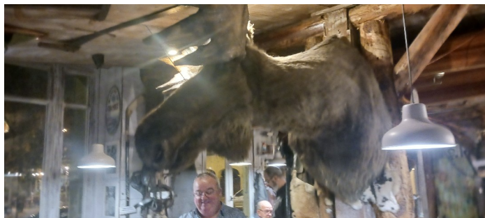
Le premier soir en arrivant, restaurant canadien, décoration et menu atypique.