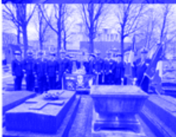
Guy LETELLIER , notre porte-drapeau au cimetière des Batignolles pour l'hommage au Cdt L'Herminier.