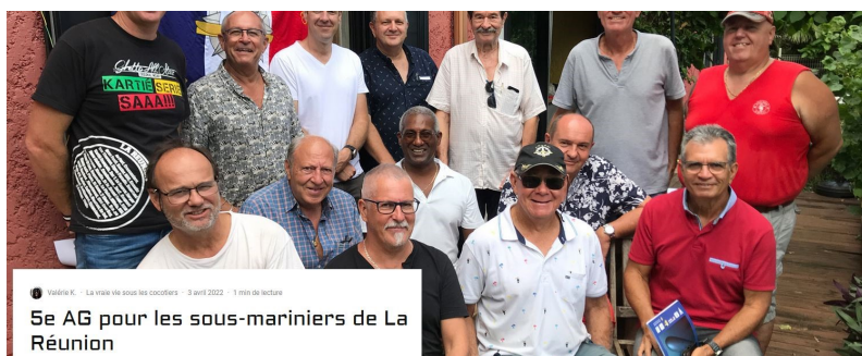
5e AG pour les sous-marins de La Réunion