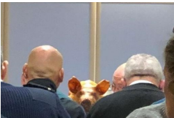
A table le cochon n'attend pas.

La journée débute par la messe à l'église St Louis avant de retrouver les participants autour de la stèle du Narval pour un hommage aux sous-mariniens disparus. Direction le cercle pour le pot des retrouvailles et le repas autour du cochon grillé qui a ravi l'ensemble des convives.