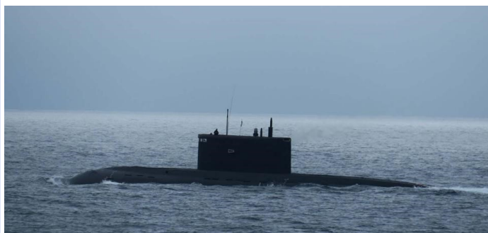
Le sous-marin de la marine russe Krasnodar dans la Manche, le 19 juillet 2020

La Royal Navy a confirmé qu'elle avait suivi un sous-marin russe lors de son passage dans la Manche de dimanche à mardi. L'approche du sous-marin a été signalée pour la première fois à Forbes dimanche. La déclaration de la Royal Navy a également confirmé notre identification du sous-marin comme étant le Krasnodar (B-265).