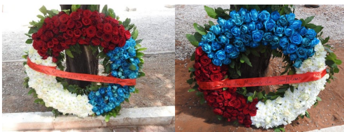
Les gerbes Aux Marins / AGASM et des familles des marins du Souffleur

L'amiral Dominique Salles Président de l'AGASM