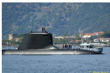
Le Suffren, les amicales Rubis et Espadon seront amateotés normalement fin 2020.

Le Suffren a pris ses marques à Toulon après les essais de la plateforme en Atlantique. Les essais relatifs aux systèmes d'armes se dérouleront en Méditerranée et permettront de valider l'ensemble de ses capacités opérationnelles. Le deuxième équipage y sera très certainement associé.