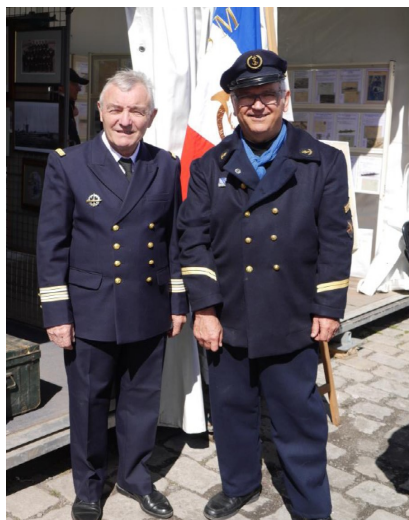
Sous-marinières contemporain et de 14/18

Durant cette semaine sur Sète, qui a cette année battu le record d'affluence avec 400 000 visiteurs, l'amicale « La Créole » a reçu sur son stand pas moins de 2800 personnes.