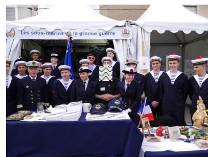
Les PMM de Nîmes et Sète sur notre stand

L'amicale La Créole avec la participation et/ou la présence mais également le support des amicales Casabianca, Rubis, Narval, Minerve et Poncelet que nous remercions très chaleureusement, a représenté durant cette semaine d'Escale à Sète, l'AGASM qui rassemble tous les sous-marinières.