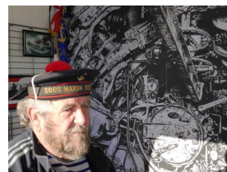
Pompon rouge en faction

Le 28 mars est la journée qui a apporté un regard différent sur les sous-marinières, c'est celle de notre participation au défilé des sous-marinières au son du BagadAix qui précédait la soirée des sous-marinières intitulée « Contes et joutes musicales, la casquette du sous-marinière ». Une soirée mémorable pour tous ceux qui s'en souviennent.