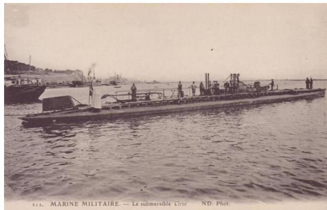
222. MARINE MILITAIRE. — Le submersible Circe.