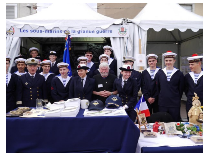
Les PMM de Nîmes et Sète sur notre stand

L'amicale La Créole avec la participation et/ou la présence mais également le support des amicales Casabianca, Rubis, Narval, Minerve et Poncelet que nous remercions très chaleureusement, a représenté durant cette semaine d'Escale à Sète, l'AGASM qui rassemble tous les sous-marinières.