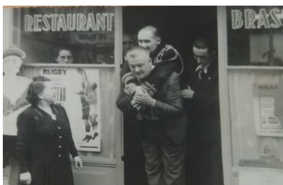
Sortie du restaurant, porté par son fidèle chauffeur

Le lendemain après le dépôt des gerbes traditionnelle et un vin d'honneur offert par l'amicale des anciens marins de Moulins, c'était l'heure du repas au restaurant de la Paix.