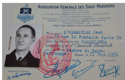
Sa carte d'adhérent

En novembre 1951, dès la création de l'AGAASM, il est déclaré membre du Haut Patronage de l'Association Générale des Sous-Marinières.