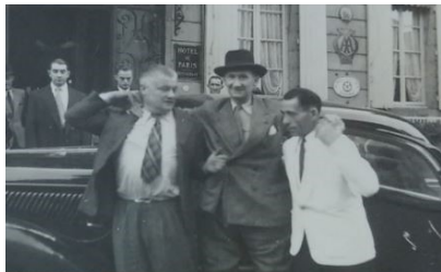
Arrivée à l'hôtel, accompagné de son fidèle chauffeur

Organisées par l'amicale des Anciens Marins de Moulins, les journées de la Marine de la ville de Moulins ont eu lieu les 7 et 8 octobre 1949.