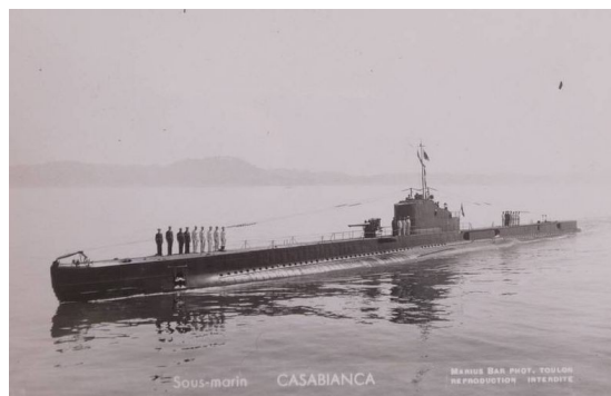
Sous marin Casabianca

(*: Le sous-marin devait initialement porter le nom de Casablanca )