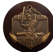
La tape de bouche de l'Inflexible qu'il avait créée.