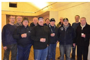
« Les déménageurs bretons » de l'amicale Minerve

Un baptême réussi, après quelques mois de travail acharné, déménagement compris; les salles du patrimoine sous-mariner sont admises au service actif, début de « patrouille » le 2 juillet 2016.