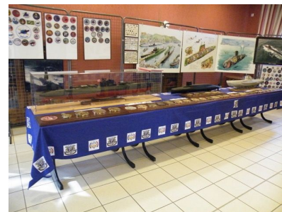
La salle d'exposition d'Etaux