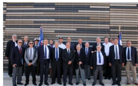
Une partie de la délégation de l'AGASM

Direction ensuite les jardins de l'escadrille pour un rafraîchissement : l'occasion pour beaucoup d'entre nous de renouer des contacts avec nos anciens « patrons » et de faire connaissance avec les sous-marinières d'aujourd'hui. Pour les simulateurs de demain, oubliez les acronymes SIENDA et SISMA, vieillissez les ORION et SIRIUS, place à JUPITER, MERCURE, NEPTUNE, TRITON, et VULCAIN ... mais aussi DIANE et MINERVE (souvenirs, souvenirs !).