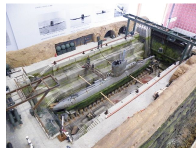
Le diorama d'un type XXIII au bassin à sec en pleine IE.