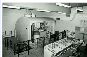
Simulateur d'Entraînement des Daphné